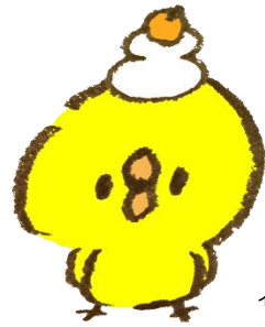
イラスト*びよたそ